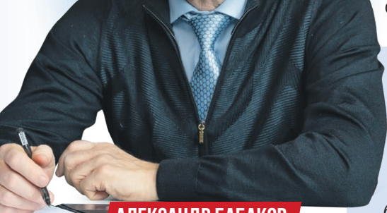
АЛЕКСАНДР БАБАКОВ

Это решит многие проблемы. А куда, например, пойдут пенсионные доходы пожилых россиян? Как правило, их детям, которые потратят эти суммы в первую очередь на покупку недвижимости. Так поступает примерно 70 % россиян, которые обладают хоть какими-то финансами.