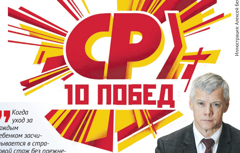
Иллюстрация: Алексей Беленёв

«Когда уход за каждым ребенком засчитывается в страховой стаж без прежнего лимита, государство наконец признает: материнский труд не заканчивается на четвертом ребенке и не может обнуляться в пенсионной системе. Раньше в стаж включали максимум шесть лет ухода, теперь учитывается период ухода за каждым ребенком до полутора лет. Это особенно важно для многодетных родителей. Но проблемы демографии не решит одной мерой. Нужны доступное жилье для молодых семей, гибкая занятость для матерей, налоговые льготы для женщин с детьми и реальная защита семейного дохода. Ребенок не должен становиться для семьи финансовым риском».