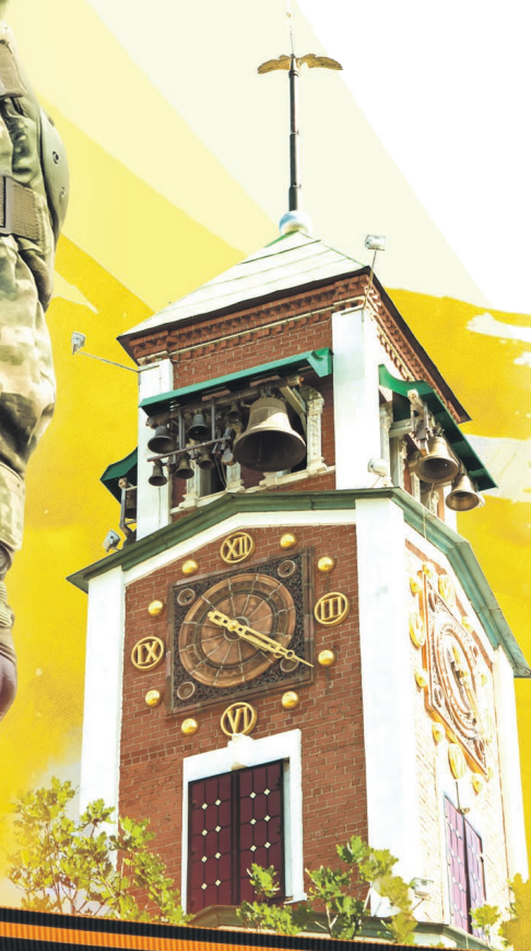
Фото: 123rf.com, Надежда Чичерова, коллаж: Алексей Беленёв