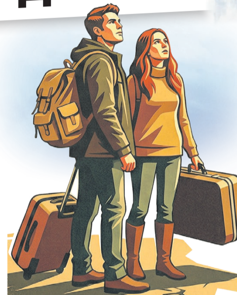
Иллюстрация: Алексей Беленев