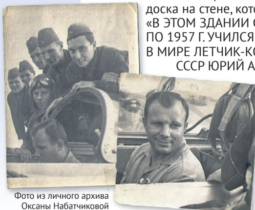
Гагарин и курсанты, 7 августа 1965 года

Незавидная судьба сложилась у дома на Советской, среди множества заброшенных зданий города оно стоит особняком: много раз меняло собственников, пережило пожары и обрушения... О легендарном прошлом сегодня напоминает разве что памятная доска на стене, которая гласит: «В ЭТОМ ЗДАНИИ С 1955 Г. ПО 1957 Г. УЧИЛСЯ ПЕРВЫЙ В МИРЕ ЛЕТИК-КОСМОНАВТ СССР ЮРИЙ АЛЕКСЕЕВИЧ ГАГАРИН».