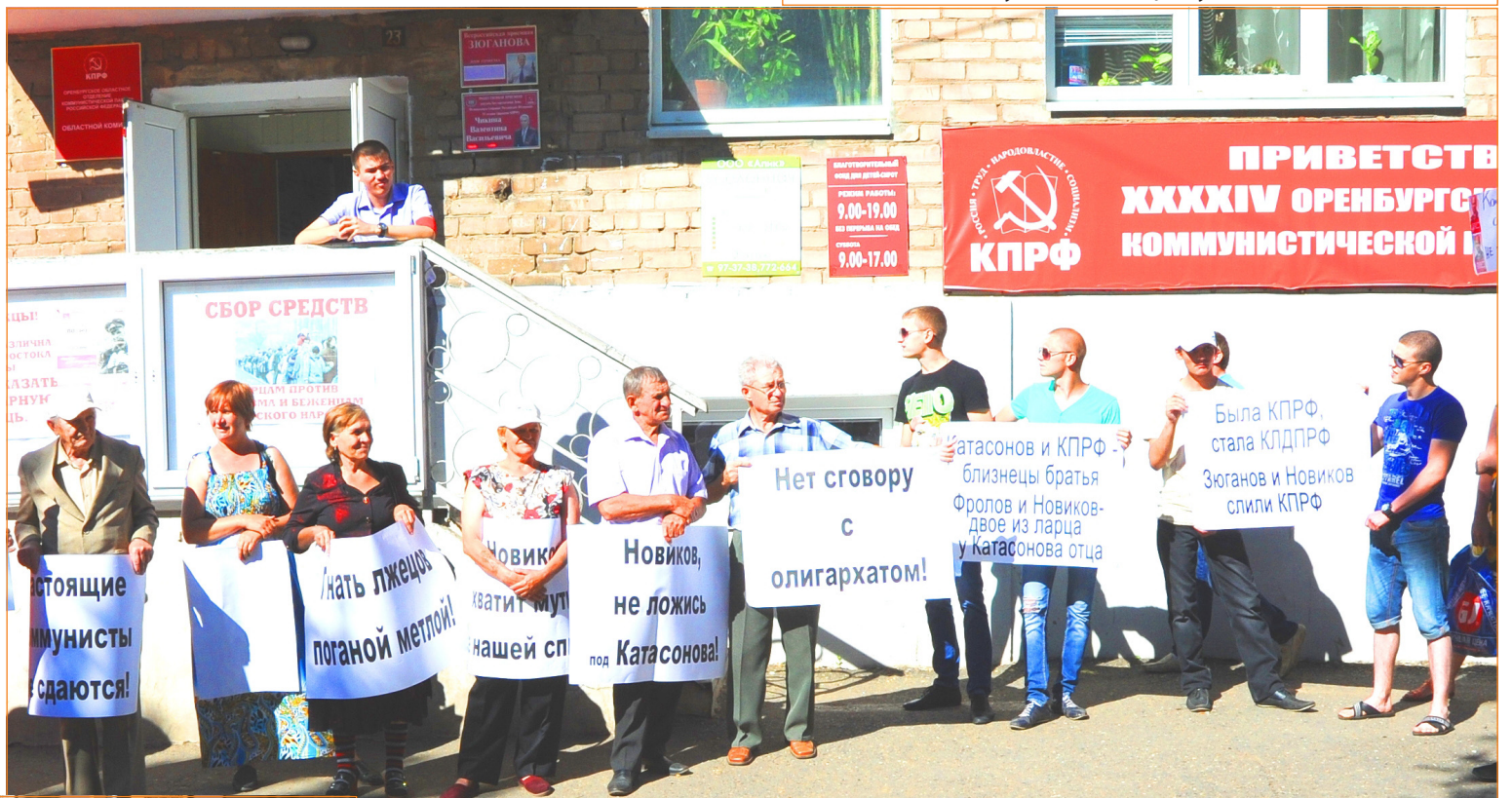
Вся компания провокаторов на пикете у КПРФ