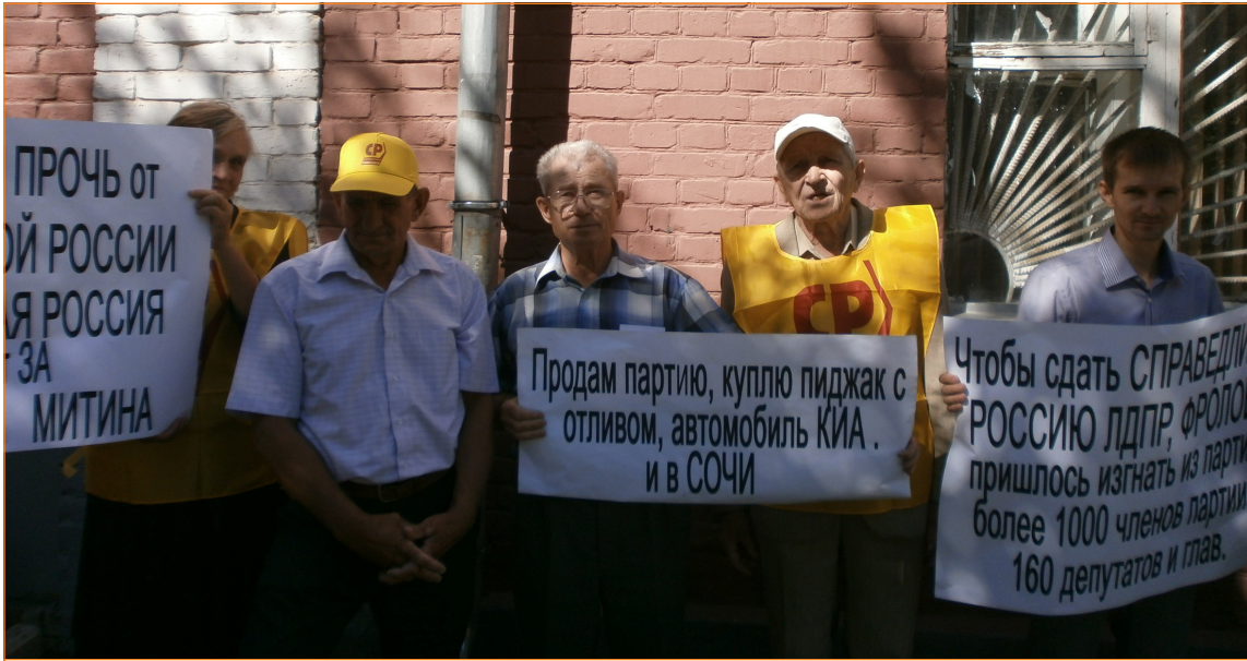
Пожилые мужчины и женщина у СР