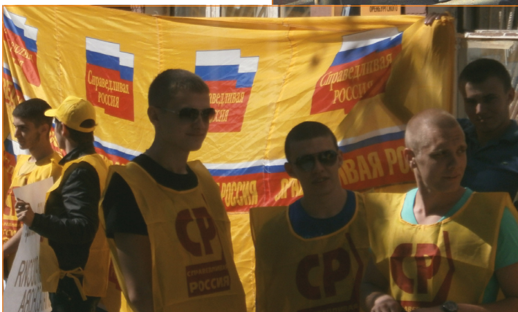
Молодые парни на пикете у СР