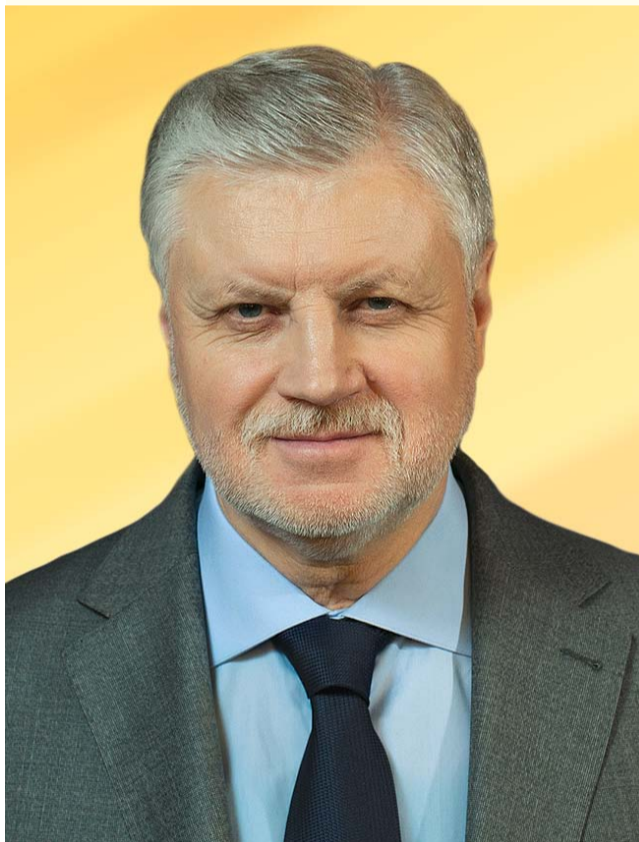
1. МИРОНОВ СЕРГЕЙ МИХАЙЛОВИЧ — председатель Политической фракции «Справедливая Россия» в Государственной Думе РФ.

Областной список кандидатов в депутаты Законодательного Собрания Оренбургской области шестого созыва, выдвинутых от партии СПРАВЕДЛИВАЯ РОССИЯ, возглавляют две кандидатуры: